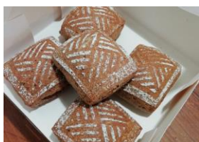
Le pain du Gouverneur.

Les travaux d'étude ont bien avancé et la mise en réseau séparatif de la rue Creuse commencera en 2026, sans date exacte à ce jour.