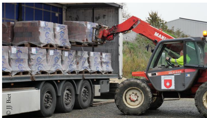
Réception des tuiles aux ateliers municipaux

Chaque habitant, en donnant 5 € ou plus, pourra inscrire son nom de façon indélébile sur l'une des tuiles destinées à être apposées sur le toit. Si vous souhaitez participer, RDV chaque samedi sur le Marché Percheron, sous la Halle de la Mairie.