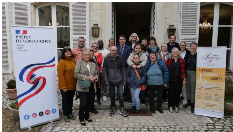
Monsieur le Sous-Préfet accueille l'exposition « L'objet de ma compétence ».

L'exposition « L'Objet de ma Compétence », réalisée par l'atelier d'arts plastiques Pirouette , l'Espace de vie sociale, l'ESAT et la Mission Locale du Vendômois avec l'aide du plasticien Mathieu Meeldijk de L'Intention Publique avait été présentée sous la Halle de Mondoubleau au printemps 2025.