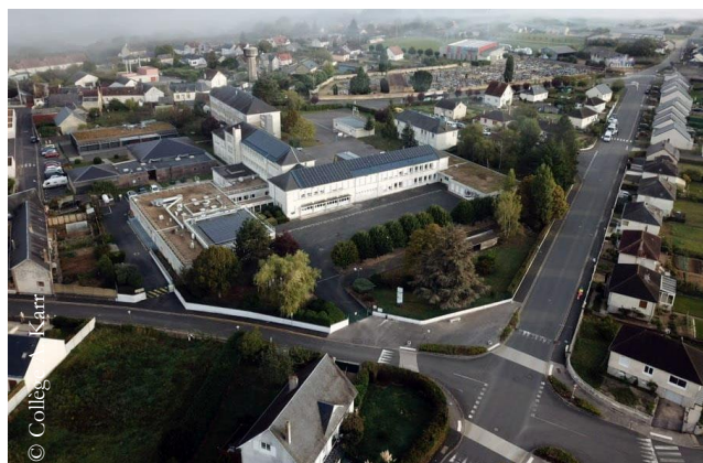
Collège Alphonse Karr vu du ciel