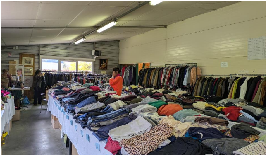
Vente de vêtements à l'APHP

Le vestiaire est organisé par un groupe de parents dont les enfants sont accueillis par l'Association pour Personnes Handicapées du Perche de Cormenon. Elles trient, rangent, vendent les vêtements qui sont propres et en bon état.