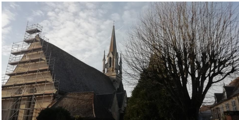
Pose de l'échafaudage

Les travaux de restauration de la toiture de l'église – charpente et couverture – ont démarré. La charpente, très fragilisée par les outrages du temps, mais aussi par les travaux de la fin du XIXe siècle (réalisation du clocher en tuffeau, suppression de plusieurs entrants dans le chœur), doit être stabilisée et l'ensemble des tuiles de la nef et des ardoises de la chapelle sud remplacées.