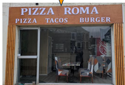
26 place du Marché.