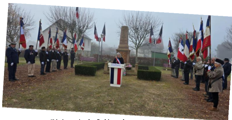
Cérémonie du 5 décembre