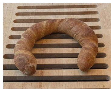
Le pain vrillé.