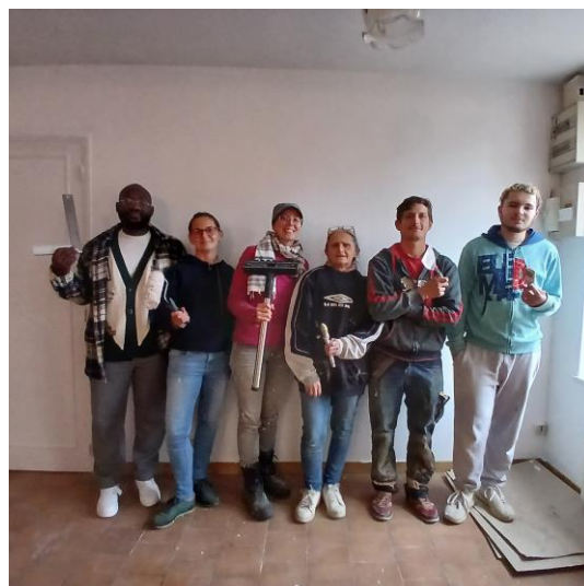
Des bénévoles motivés, prêts pour le chantier de rénovation.

La maison du 6-8 Leroy, qui abrite « L'Atelier du Faire », destinée à accueillir les ateliers de L'Egrenne (atelier numérique dit « FabLab », ateliers de réparation de petits équipements, ateliers autour du bâti ancien, etc.) a bénéficié d'une remise à neuf, grâce à la participation d'une dizaine d'habitants motivés (91 heures de bénévolat !). L'électricité est confiée à un professionnel pour une remise aux normes, et les services techniques poseront carrelages et plancher. Le local est presque prêt et accueillera bientôt les premiers ateliers.