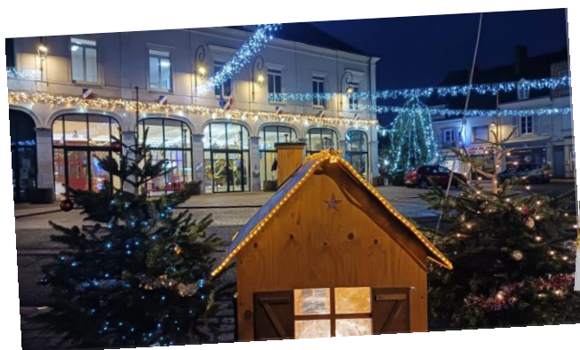
La place du Marché décorée