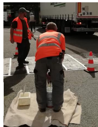
Les employés municipaux ont procédé à la réfection du marquage au sol.