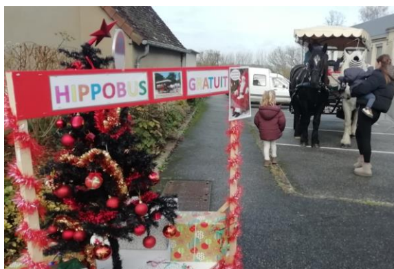
Le 6 décembre, marché de Noël de l'Ehpad et de l'Ucam