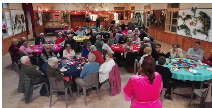
Le 11 décembre : Goûter des Aînés