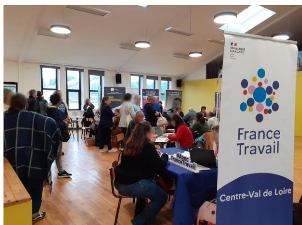
Forum de l'emploi le 9 octobre 2025, organisé par France Services, en partenariat avec France Travail et L'Egrenne.

Enfin, L'Egrenne participe à la dynamique du Territoire d'Industrie « Perche Industrie » regroupant les 4 Communautés de Communes du Perche (28-Nogent le Rotrou), des Collines du Perche (41-Mondoubleau), Terre de Perche (28-La Loupe) et Forêts du Perche (28-Senonches). Porté par l'Agence nationale de la cohésion des territoires et la Direction Générale des Entreprises, ce programme souhaite déployer une stratégie de reconquête industrielle « par et pour les territoires ». Ainsi, L'Egrenne participe en lien avec Dev'Up, responsable de la mission, à la mobilisation des industries sur ce territoire à travers des temps de mise en relation, des rencontres thématiques, etc.