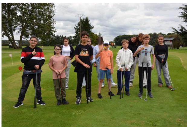
Partie de golf pour les élèves de l'internat

Le mercredi après-midi est consacré aux activités thématiques, en cohérence avec le projet d'établissement : atelier potager, web radio, création vidéo, activités sportives... Autant d'occasions pour les élèves de découvrir, expérimenter et approfondir leurs centres d'intérêt.