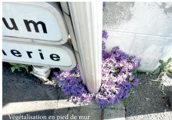
V g talisation en pied de mur