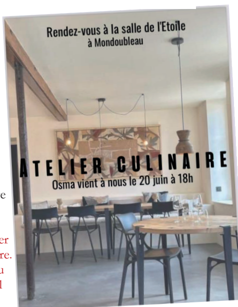
Le 20 juin : atelier culinaire à la salle de l'Etoile. Prochain atelier le 19 septembre. Réservation au 06 63 70 97 01