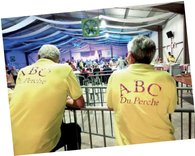
Le 3 juin, bœuf grillé organisé par l'association ABC du Perche