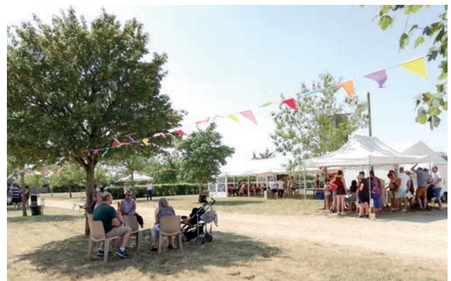
Le 25 juin : fête de l'école au Parc hippique des Collines du Perche