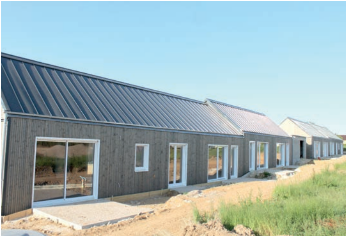
Construction de 20 logements

L'association pour personnes handicapées du Perche (APHP), avec le soutien de la Communauté de Communes des Collines du Perche, des communes de Mondoubleau et de Cormenon ainsi que du Conseil départemental, a construit 20 logements de plain-pied (2 T3 et 18 T1bis) route des Grands Jardins, rue de la Concorde à Cormenon.