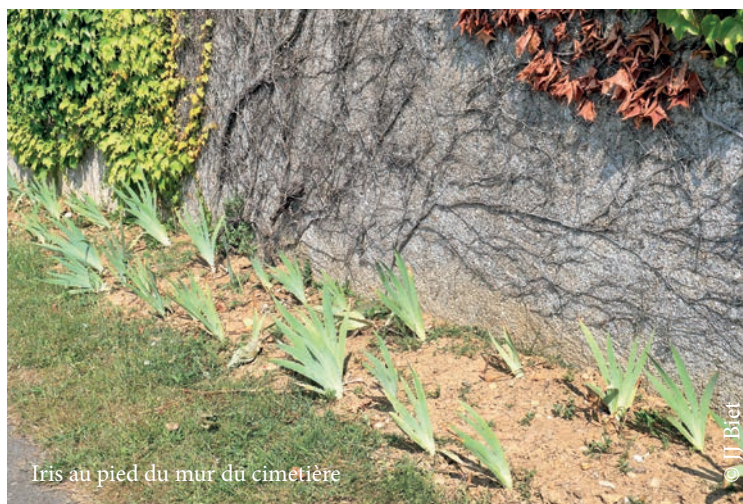
Iris au pied du mur du cimet re

Dans de nombreuses villes et villages, c'est ainsi que sont n s de v ritables « rues-jardins », avec la participation des riverains. Il suffit parfois de d poser quelques graines dans des interstices inoccup s ou de d couper une bande de trottoir (avec l'aide des services techniques) et d'y installer quelques plantes grimpantes ou couvre-sol (ex rue des Poilus).