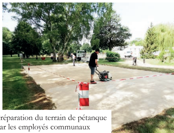
Préparation du terrain de pétanque par les employés communaux