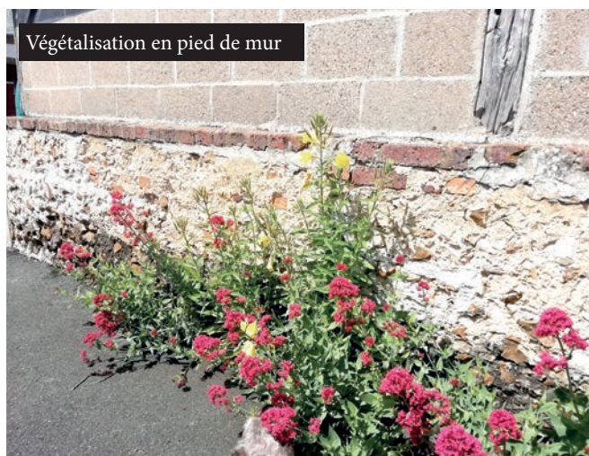
V g talisation en pied de mur

Pour que les habitants profitent pleinement de ces espaces cet  t , de nouveaux investissements ont  t  r alis s : bancs, poubelles neuves, distributeurs de sacs de propret  canine, r ceptacles   m gots, panneaux d'affichage, command s au printemps, seront install s d s que possible par les employ s communaux.