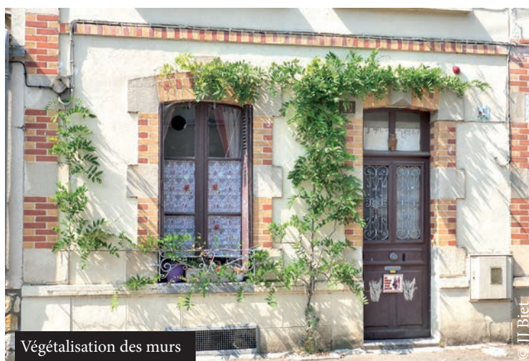
V g talisation des murs