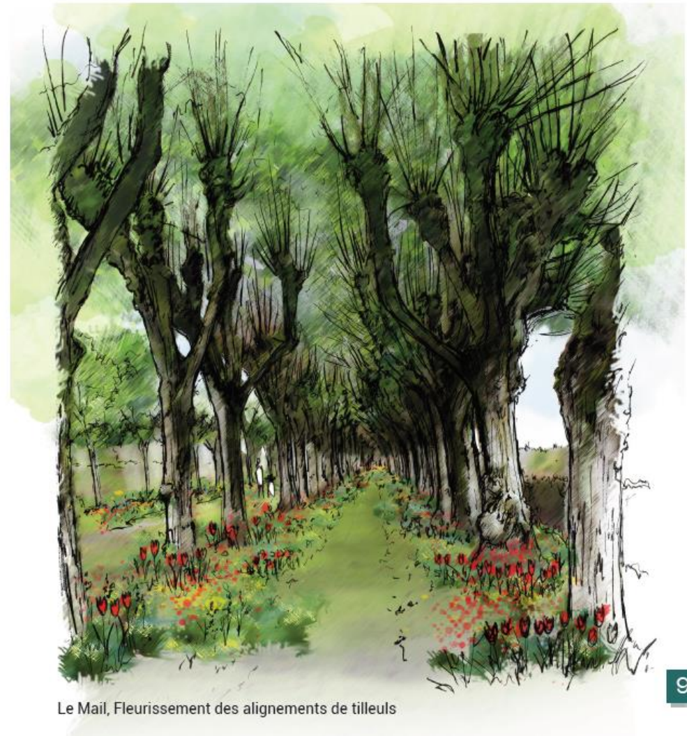
Le Mail, Fleurissement des alignements de tilleuls