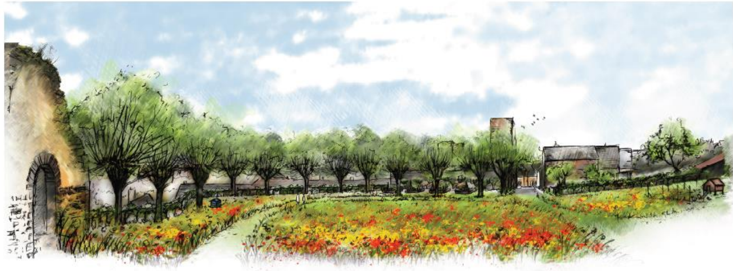
La place de la Tour, un nouvel espace de convivialité