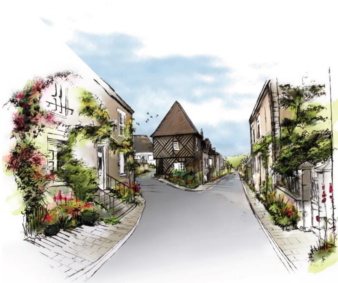
La Ville Basse, rue du Pont de l'Horloge Fleurissement des pieds de façades